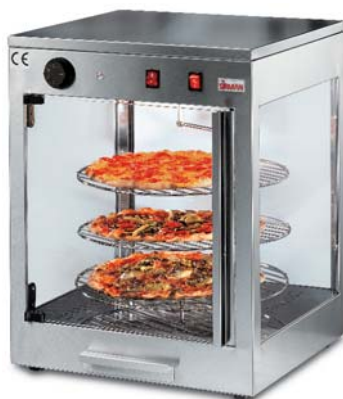
VETRINETTA Ø 38